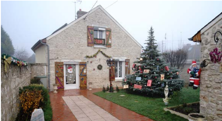
Mme JOSSE Michèle 1er prix

Le conseil municipal d'enfants a procédé à la notation le samedi 16 décembre 2023. Les récompenses seront remises à chaque participant, durant le deuxième semestre 2024, lors d'une cérémonie spécifique.