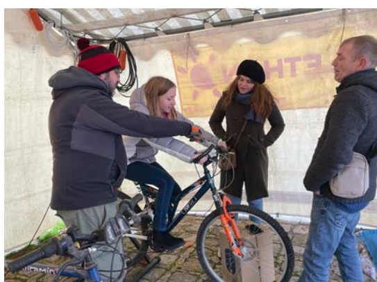
Stand téléthon tenu par UPUPIDES